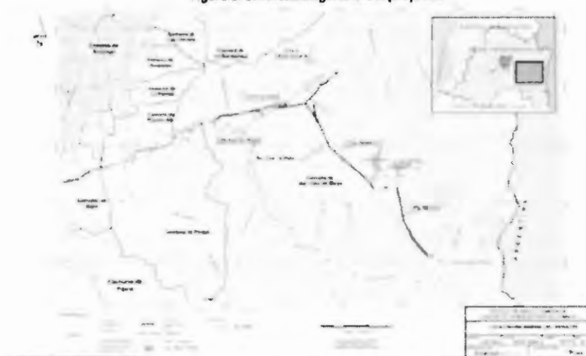
Figura 1: Localización general del proyecto.